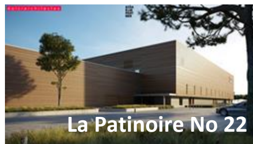
La Patinoire No 22

Syndicat intercommunal du district de Porrentruy